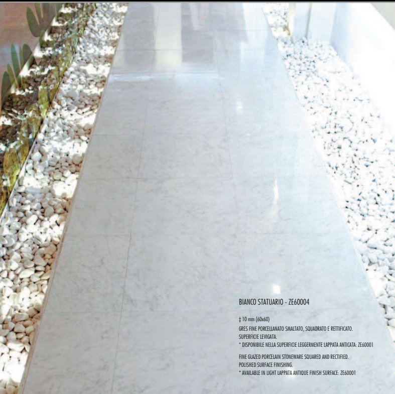
BIANCO STATUARIO - ZE60004

± 10 mm (60x60) GRES FINE PORCELLANATO SMALTATO, QUADRATO E RETTIFICATO. SUPERFICIE LEVIGATA. * DISPONIBILE NELLA SUPERFICIE LEGGERMENTE LAPPATA ANTICATA: ZE60001 FINE GLAZED PORCELAIN STONEWARE SQUARED AND RECTIFIED. POLISHED SURFACE FINISHING. * AVAILABLE IN LIGHT LAPPATA ANTIQUE FINISH SURFACE: ZE60001