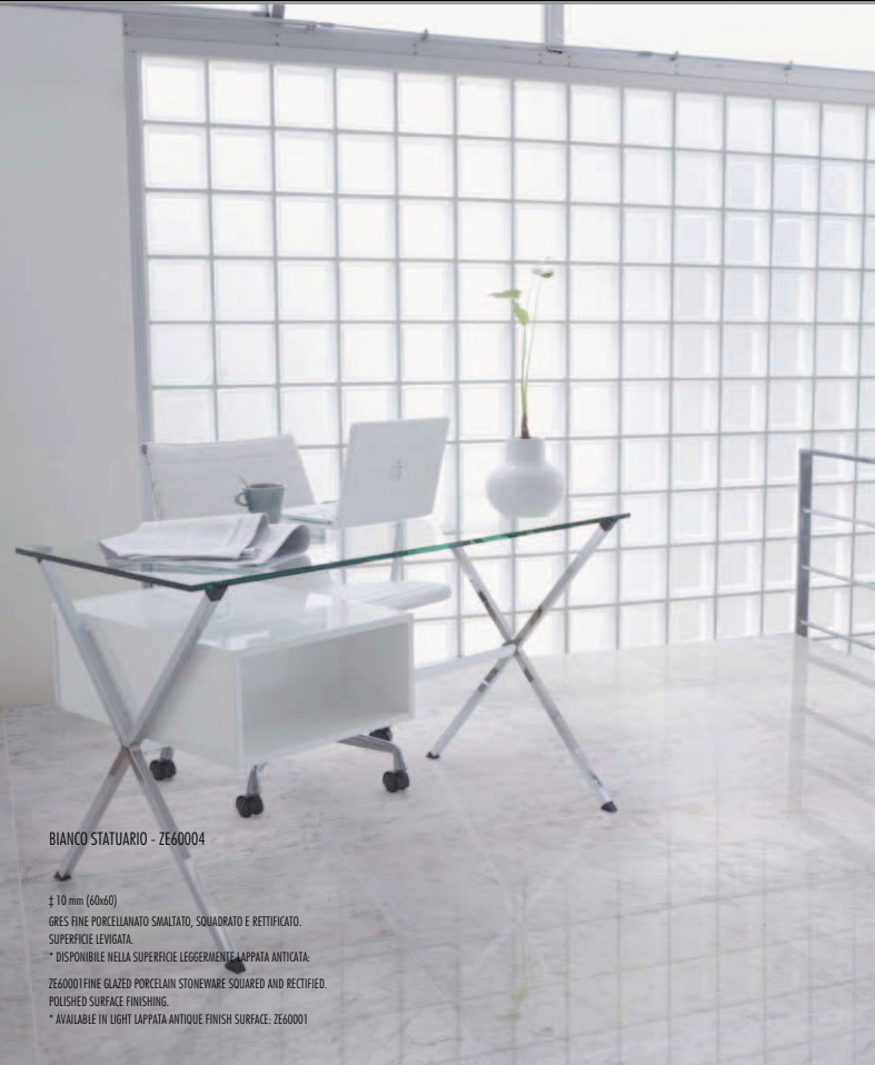
BIANCO STATUARIO - ZE60004

± 10 mm (60x60) GRES FINE PORCELLANATO SMALTATO, SQUADRATO E RETTIFICATO. SUPERFICIE LEVIGATA. * DISPONIBILE NELLA SUPERFICIE LEGGERMENTE LAPPATA ANTICATA: ZE60001 FINE GLAZED PORCELAIN STONWARE SQUARED AND RECTIFIED. POLISHED SURFACE FINISHING. * AVAILABLE IN LIGHT LAPPATA ANTIQUE FINISH SURFACE: ZE60001