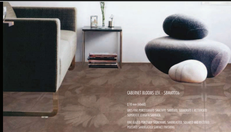
CABERNET BLOOMS LEV. - SBM60006

± 10 mm (10x60) GRES FINE PORCELLANATO SMALTATO, QUADRATO E RETTIFICATO. SUPERFICIE LEVIGATA. FINE GLAZED PORCELAIN STONEWARE SQUARED AND RECTIFIED. POLISHED SURFACE FINISHING.